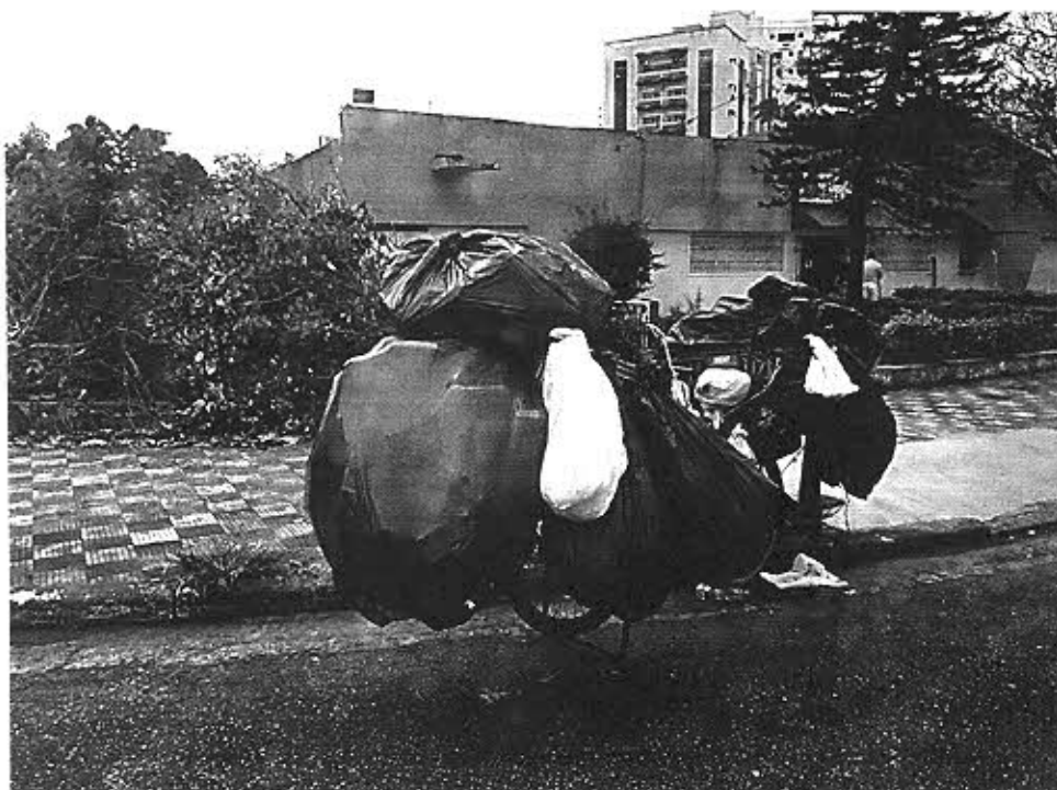
R. Enguaguaçu - em frente E.E. Dona Luiza Macuco