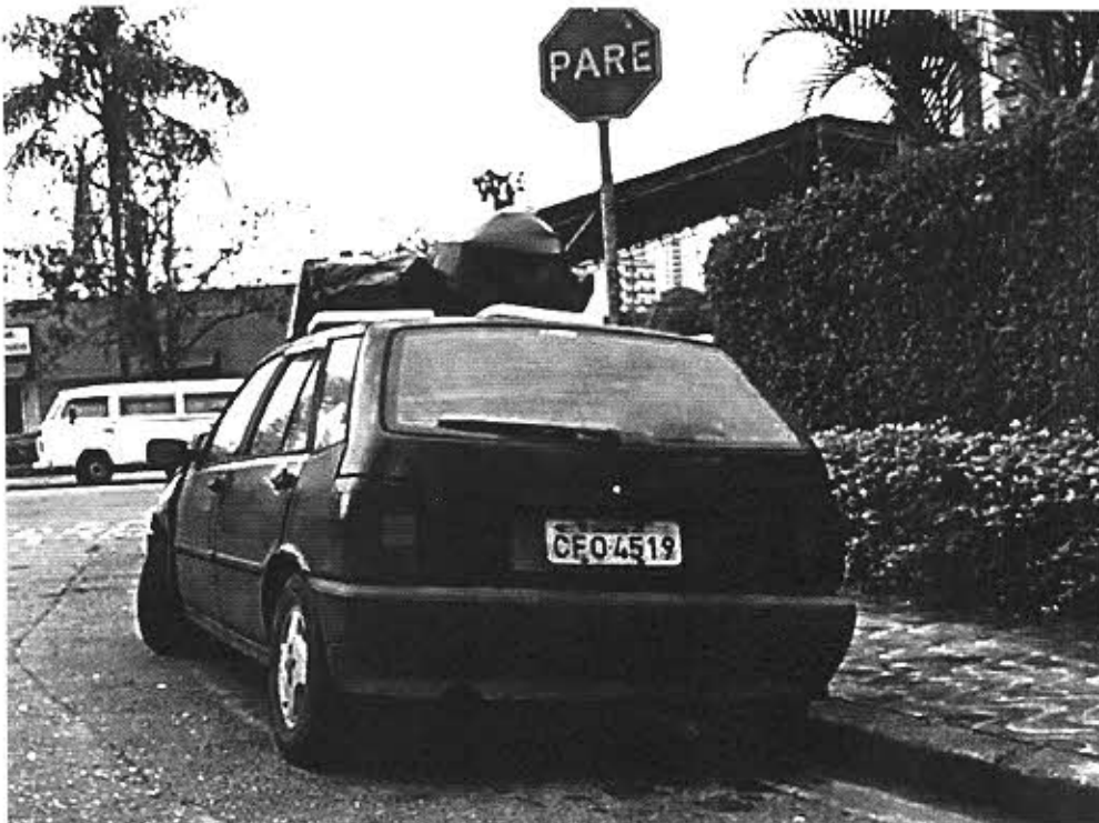
Rua Irmão José Isidoro, s-n em frente ao Posto de Gasolina.