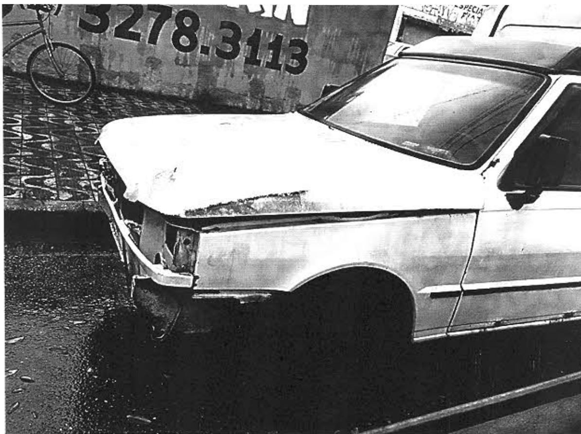
Av. Afonso Pena, em frente ao nº 477-535