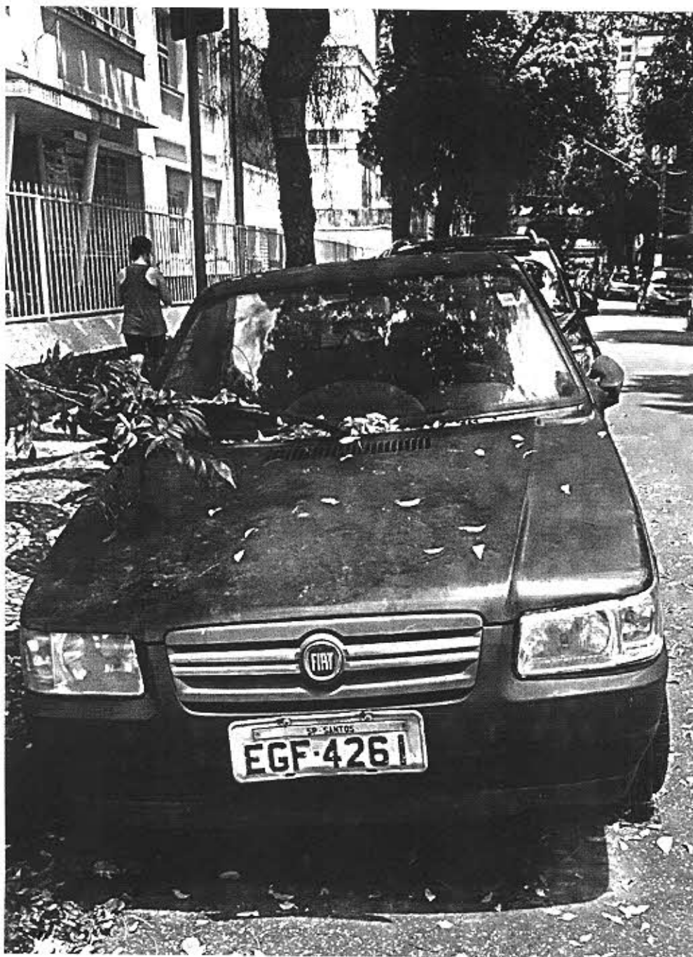
Rua Américo Martins